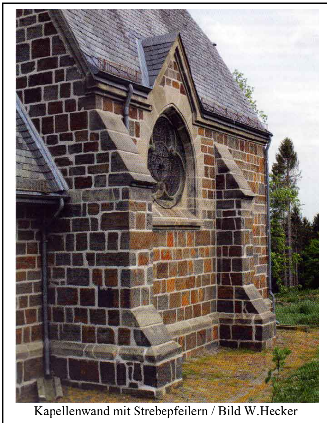
Kapellenwand mit Strebebfeilern

Einen wesentlich besseren Einblick in die Grauwackenunterwelt bot die ab 1899 unterhalb des Hammerbergs längsdampfende Landeseisenbahn. Die hatte ursprünglich von Belecke komend auf die Mülheimer Seite biegen und dort weiterfahren sollen. Der geänderte Plan, auf der Sichtigvorer Seite zwischen Hammerberg und Möhne zu fahren, machte es notwendig, die Gleisstrecke längs in den Hang des Hammerbergs zu verlegen, diesen also zum Teil abzuschürfen. Dabei traten auf der stehen gebliebenen senkrechten Hangseite Grauwackenschichten klippenartig heraus. Wie auf dem Bild zu sehen, zeigten sie sich in einer bescheidenen