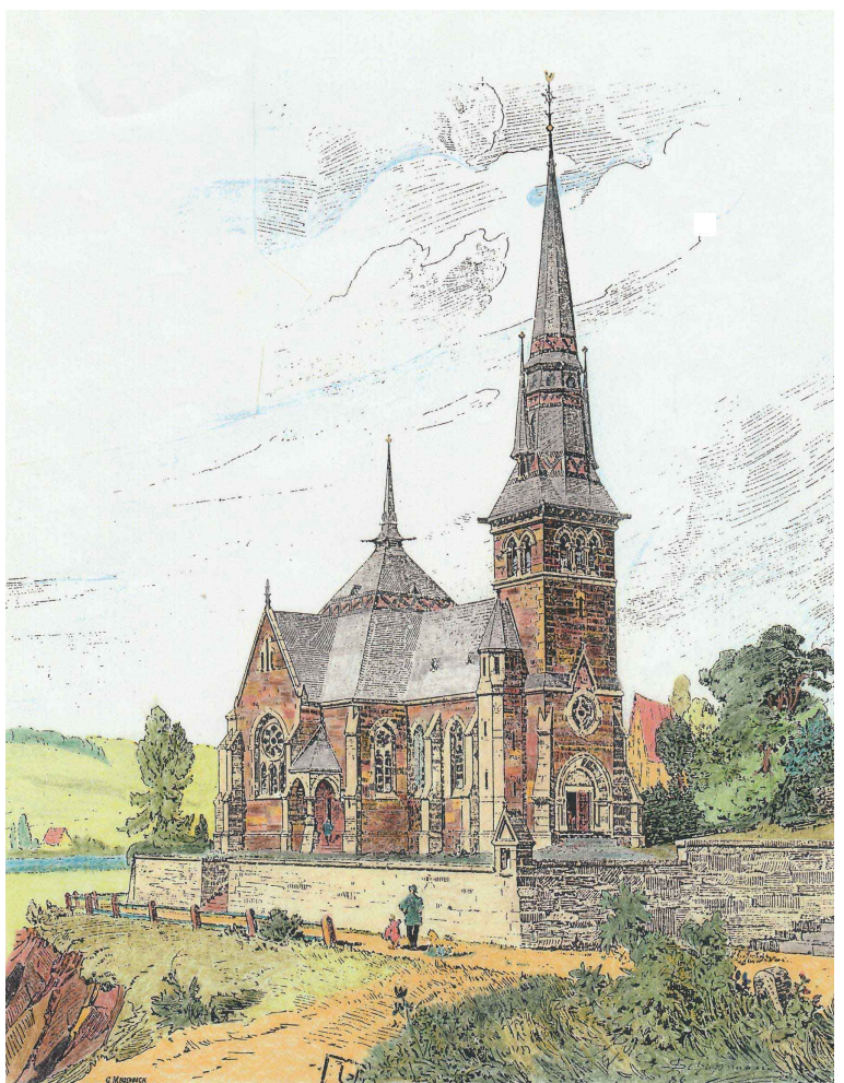
Schupmanns Zeichnung / koloriert W.Hecker

In den Jahren nach der Jahrhundertwende 1900 setzte sich der wirtschaftliche Aufstieg von Loags Grauwackenunternehmen fort.