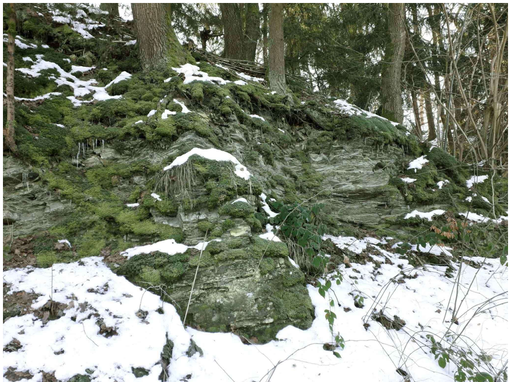
Klippen unterm Hammerberg

eindrucksvoller Felsbänke waren. Die Geologen 1 haben nun herausgefunden, dass das hier in Sichtigvor liegende Gestein nicht an Ort und Stelle aus Felsen zerfallen ist, sondern mit Lehm aus höherer Lage herunterfloss und zusammen als 1 Meter mächtiger „Hanglehm“ den